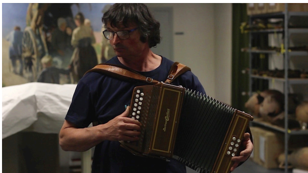
L'expiration , 2016, vidéo, capture d'écran