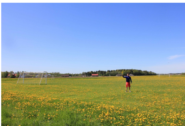
Balle Perdue , 2012 Tirage numérique, 50x70cm