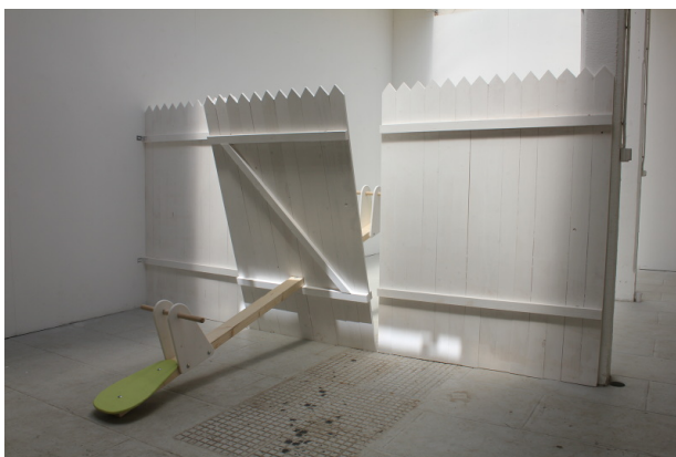
Mauvaise Fréquentation , 2015 Installation, bois peinture et visserie 180x300x400cm