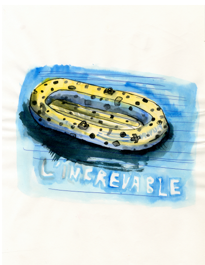
L'incroyable , 2016, aquarelle, 65 x 50 cm